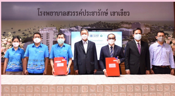
โรงพยาบาลสวรรค์ประชารักษ์ เขาเขียว

บล. เอเชีย พลัส, บล. หยวนต้า (ประเทศไทย), บล. เคทีบีเอสที, บล. โนมูระพัฒนสิน, บล. ฟิลลิป (ประเทศไทย), บล. เมอร์ซัน พาร์ทิเนอร์ ด้านนายทะเบียนหุ้นกู้ มีธนาคารกรุงศรีอยุธยา จำกัด (มหาชน) เป็นผู้ดำเนินการ ด้านบริษัท ทริสเรทติ้ง จำกัด ได้จัดอันดับความน่าเชื่อถือของบริษัทที่ระดับ "BBB-" แนวโน้มอันดับเครดิต "Stable" เมื่อวันที่ 15 มิ.ย. 64