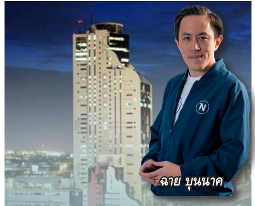
จาย บุนนา

บมจ.พีซีซี คอร์ปอเรชั่น หรือ PCC ส่ง พีซีซี ซีสเท็ม แอนด์ โปรเจ็ค ซึ่งเป็นบริษัทในเครือ ร่วมลงนามสัญญากับบมจ.สามารถเทลคอม หรือ SAMTEL ในการจัดซื้อ Smart Meter สำหรับโครงการติดตั้งระบบมิเตอร์อัจฉริยะ (AMI) สำหรับผู้ใช้ไฟฟ้ารายใหญ่ ซึ่ง SAMTEL เป็นคู่สัญญากับการไฟฟ้าส่วนภูมิภาค(กฟภ.) มูลค่าโครงการทั้งสิ้น 2,359.96 ล้านบาท โดยโครงการดังกล่าวจะช่วยเพิ่มประสิทธิภาพของระบบ AMI สำหรับผู้ใช้ไฟฟ้ารายใหญ่ ที่ดูแลครอบคลุมพื้นที่ทั่วประเทศ ให้เป็นไปตามกรอบการดำเนินการพัฒนาระบบโครงข่ายอัจฉริยะ (SMART GRID) ของกฟภ.